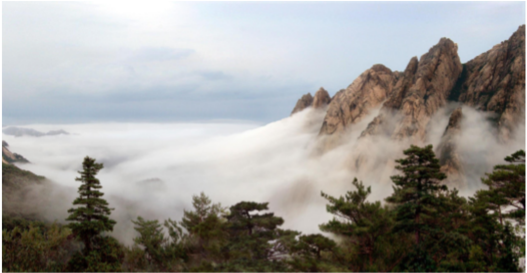
Schluchten von Äußerem Kumgang