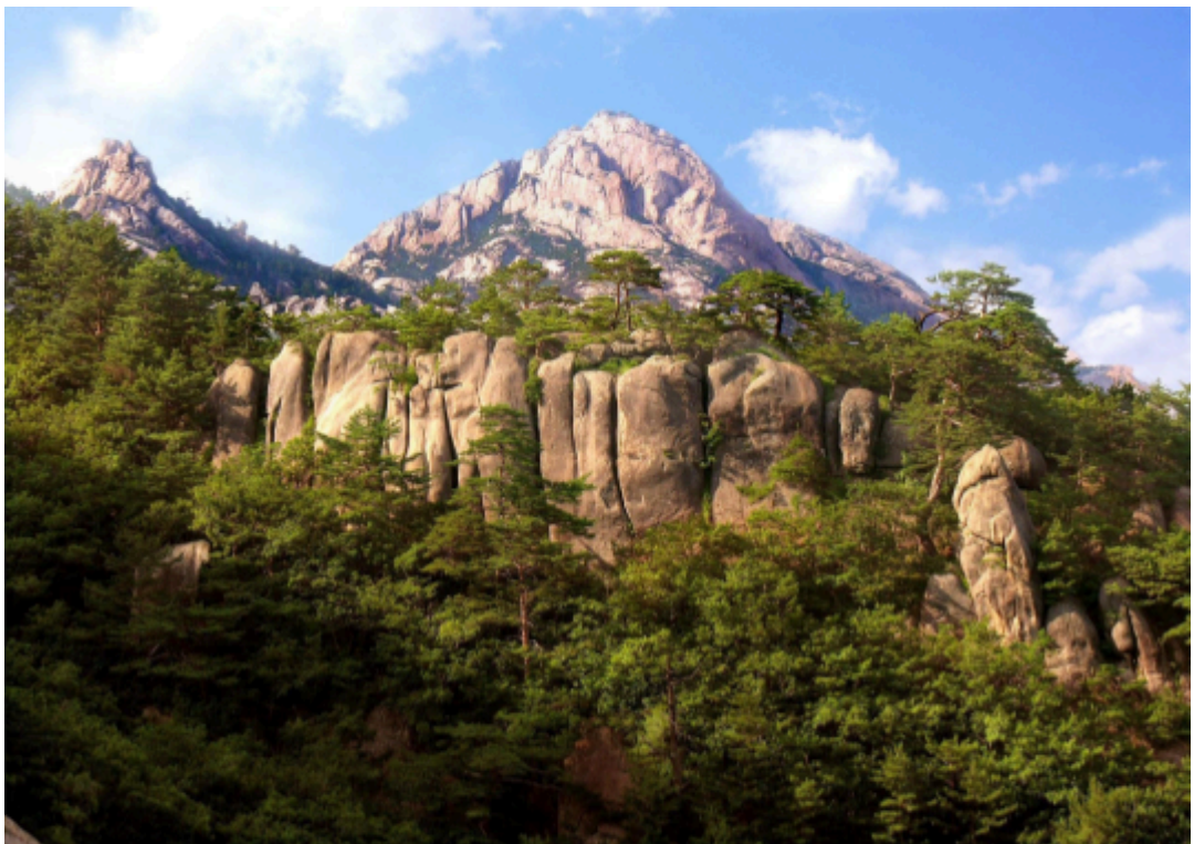
Bizarre Felsen des Sujong-Berges